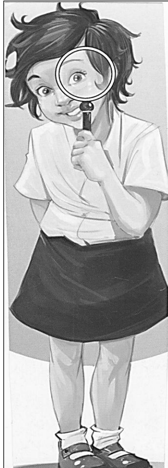
[Bron Hoezit! , Junie 2012] [50]