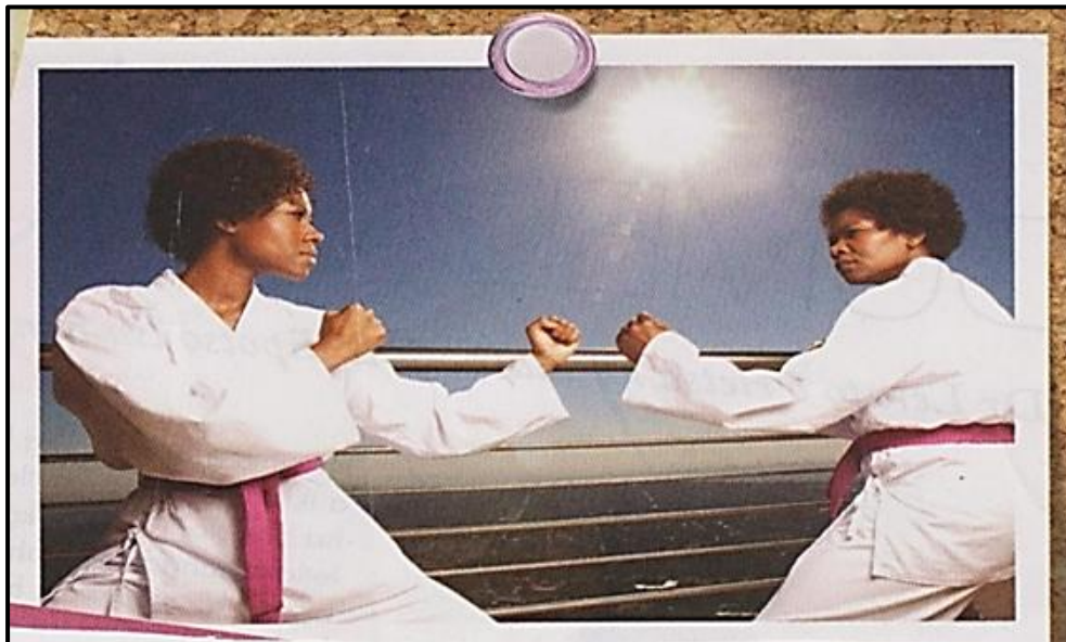
[Setshwantsho se qotsitse ho bona, Motsheanong 2014] [50]