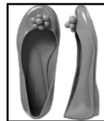
Twee paar skoene