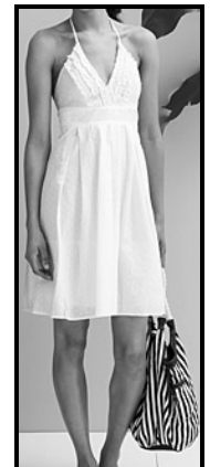
Een rok met dun bandjies