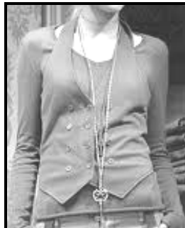
Een linne- onderbaadjie