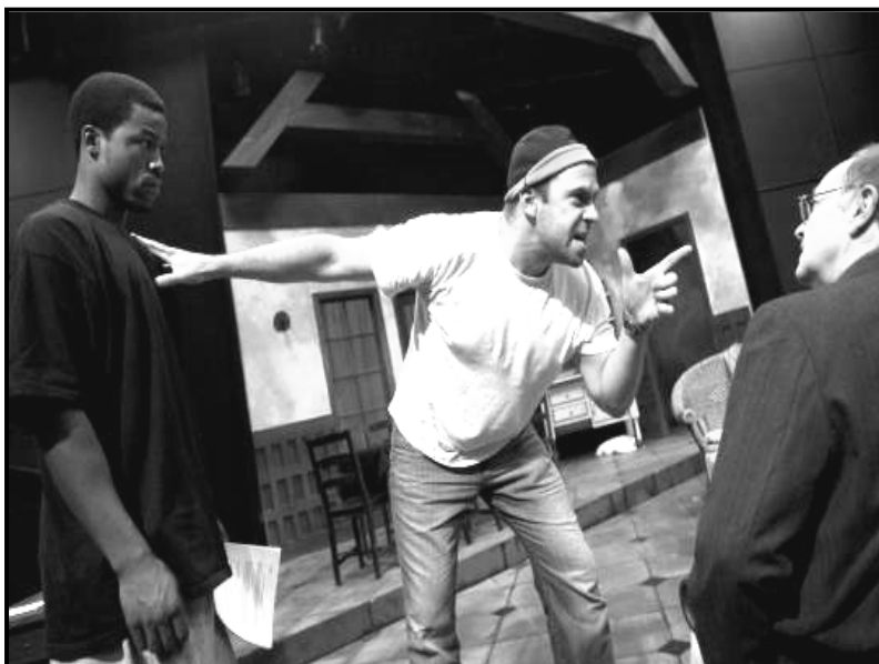
'n Toneel uit 'n produksie van Groundswell

Bestudeer die bronne hieronder en beantwoord die vrae wat volg.