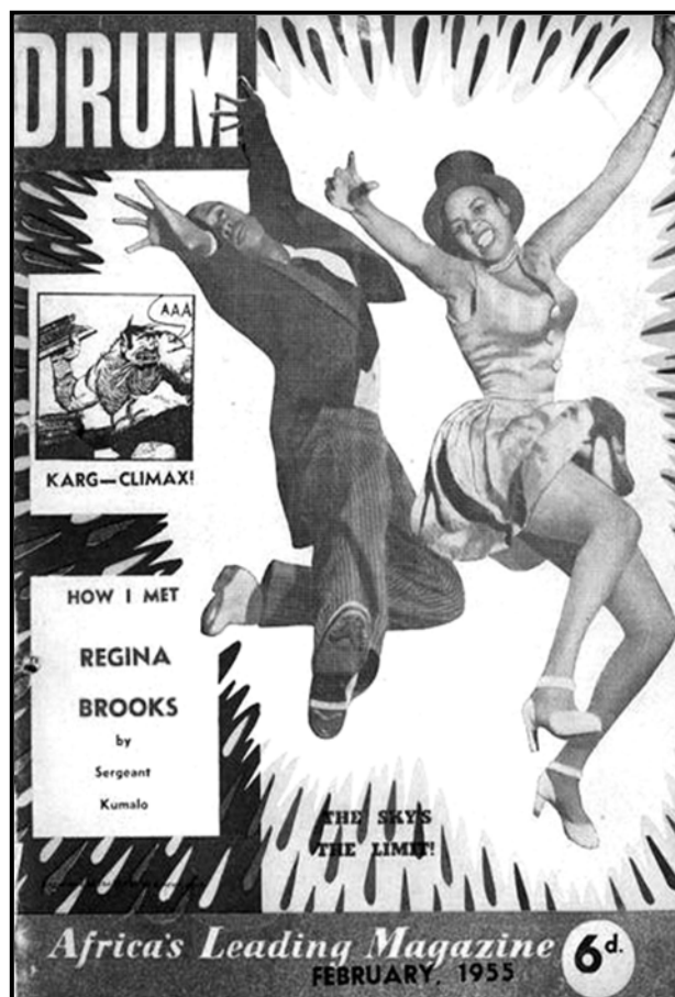
'n Voorblad van Drum -tydskrif