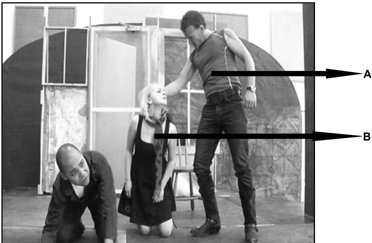
'n Toneel uit 'n produksie van Siener in die Suburbs

Bestudeer die bronne hieronder en beantwoord die vrae wat volg.