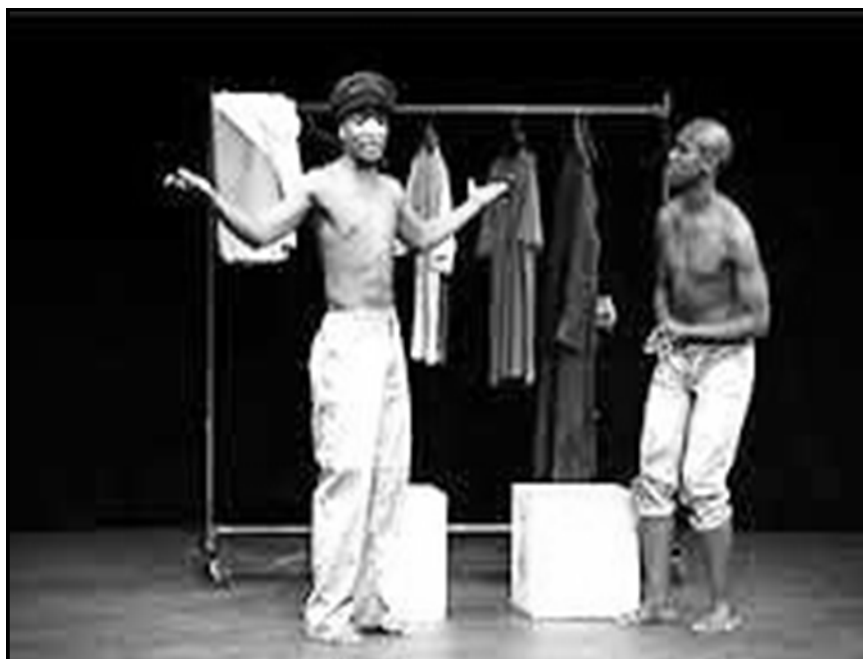
'n Toneel uit 'n produksie van Woza Albert!

Bestudeer BRON A hieronder en beantwoord die vrae wat volg.