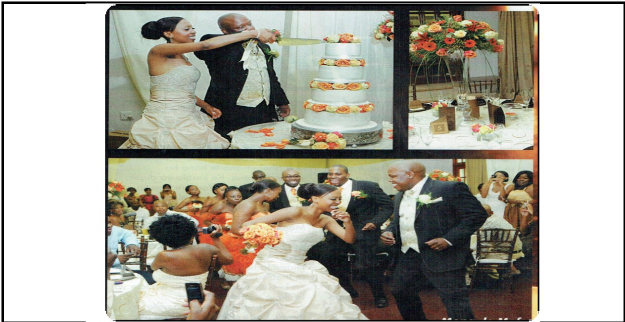
[E qositswe le ho lokisetswa tlhahlobo ho tswa ho BONA ya Sesotho, Phupu 2012:69]

Boha tema ena e latelang mme ha o qetile o arabe dipotso tse latelang.