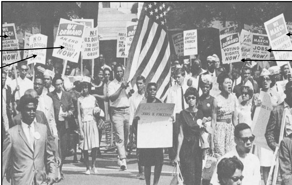
[Uit The Day They Marched deur DE Saunders]

Die foto hieronder is uit 'n boek met die titel The Day They Marched , deur DE Saunders. Dit toon burgerregte-optogangers met plakkate gedurende die Opmars na Washington op 28 Augustus 1963.